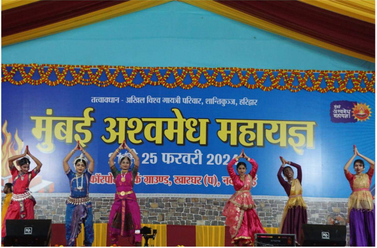
समूह योग प्रदर्शन