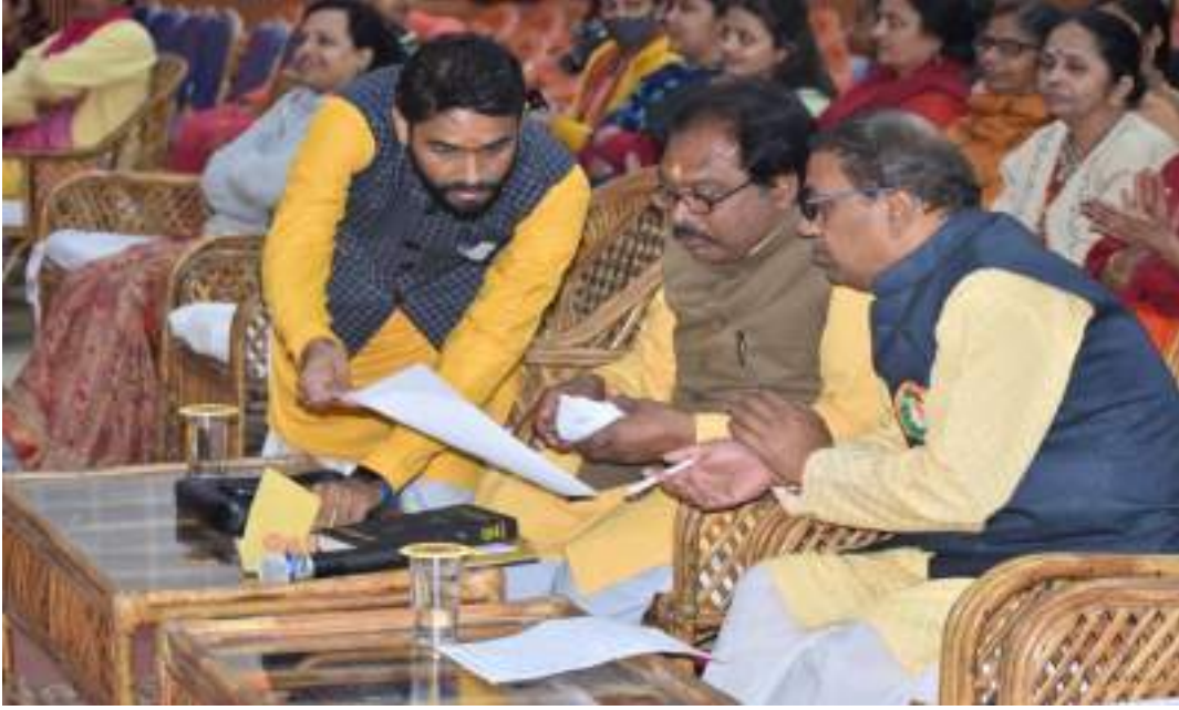
एकल शास्त्रीय नृत्य प्रतियोगिता