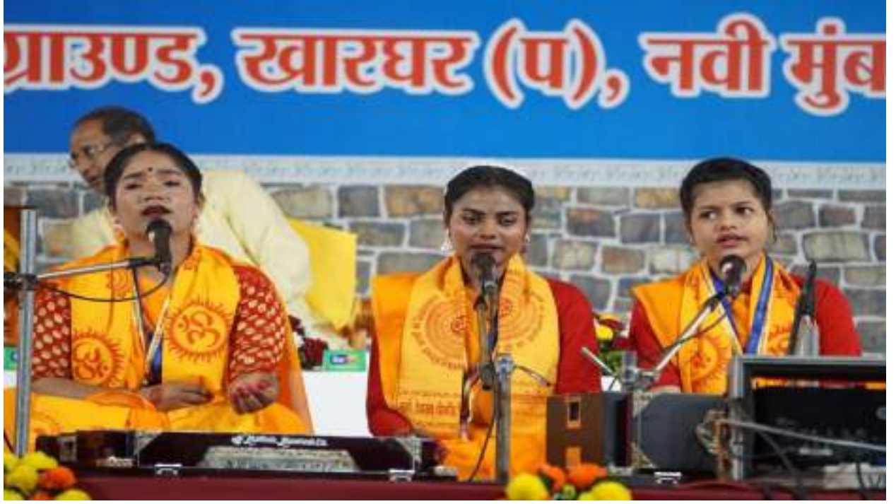
समूह प्रज्ञा गीत